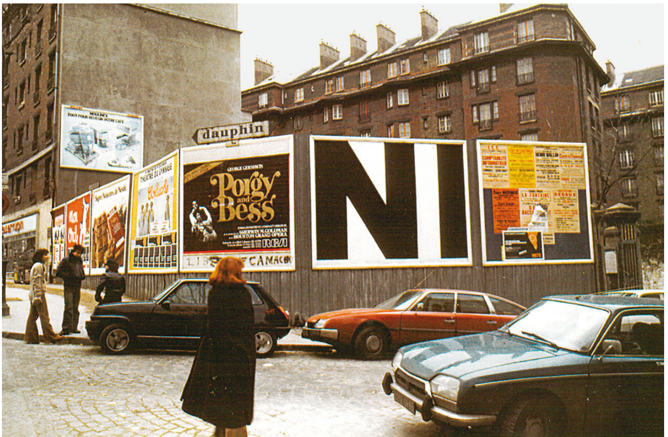
Tania Mouraud, City Performance 56, 1977-78